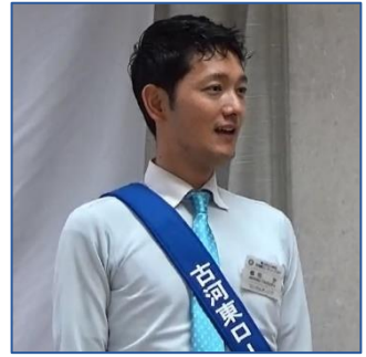
四つのテスト、古河東ロータリークラブソング